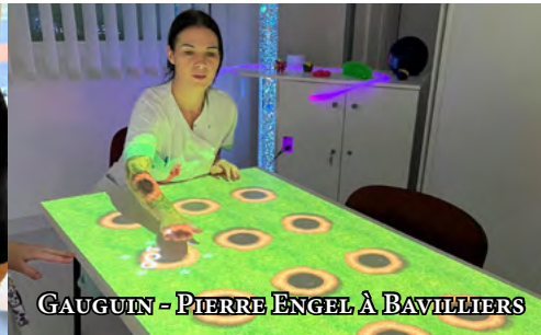
GAUGUIN - PIERRE ENGEL À BAVILLIERS